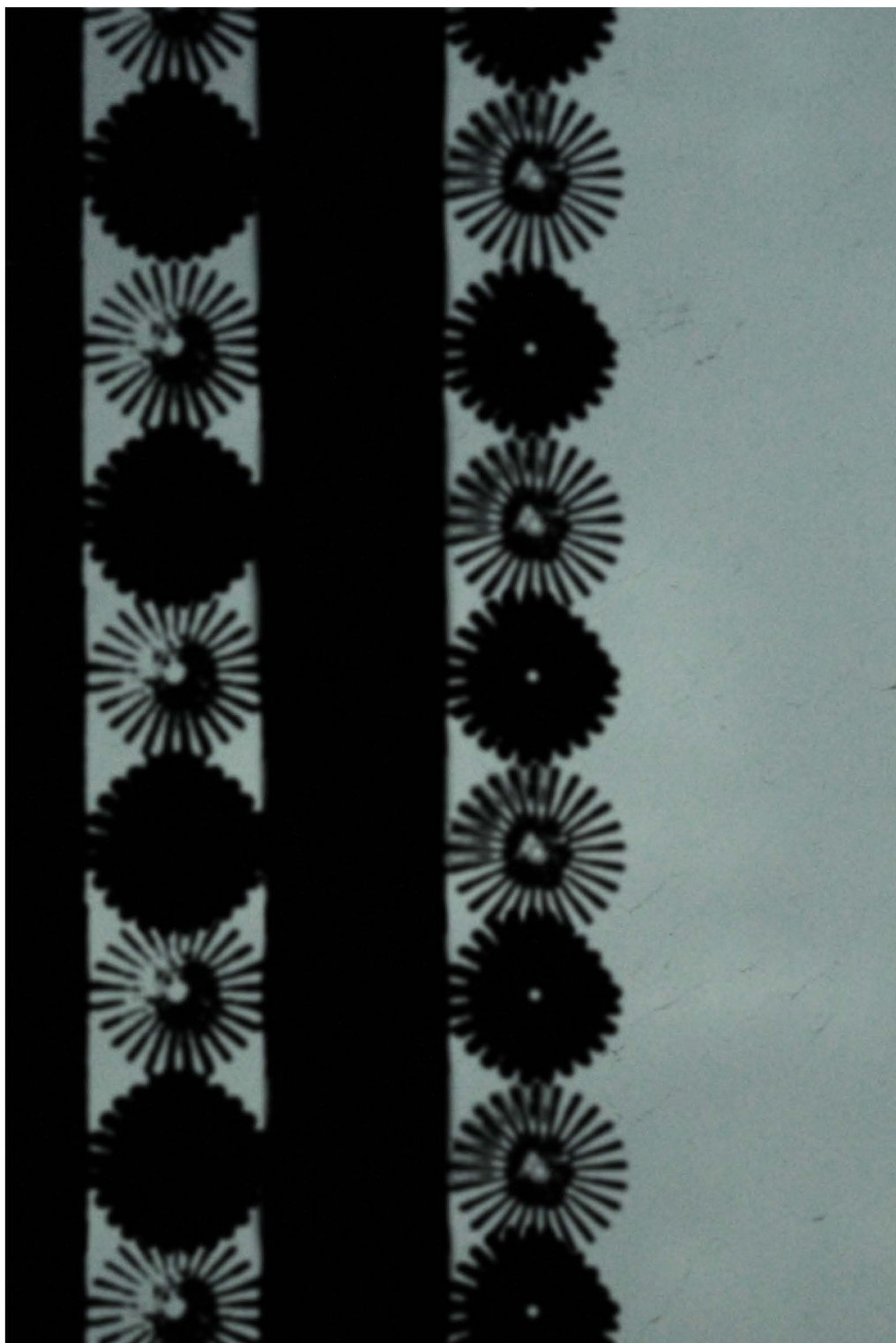
ntamo MERI VESANTO Hartaita lauluja