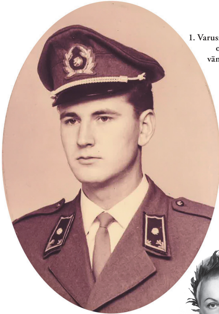
1. Varusmiespalvelus ohi. Reservin vänrikki siirtyy siviiliin. v. 1961