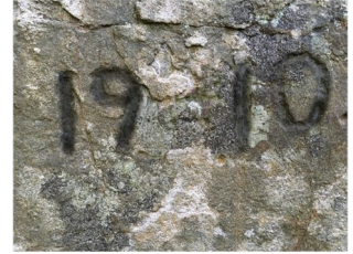
Suurenkiven kylkeen on hakattu vuosiluku 1910, jota tämä kirja käsittelee. JUHA RIIHIRANTA

Kataloisten alue sai ensimmäiset asukkaansa 1300-luvun alkupuolella, kun Ruotsin kuningas antoi luvan muuttaa asumaan sisämaan korpiin. Uudistalot lisäsivät kuninkaan tuloja ilman, että vanhojen talonpoikien veroja tarvitsi nostaa. Lammin kirkonkylän paikkeilla sijaitsi tuolloin yksi eteläisen Hämeen merkittävimmistä asutuskeskittymistä, jonka eräalueet levittäytyivät pohjoiseen ja etelään. Vanhojen nautinta-alueiden perintönä Lammin pitäjä on saanut nykyisen, erikoisen kolmitahoisen muotonsa. Pitäjä on pohjois-eteläsuunnassa hyvin pitkä ja samalla hieman idän suuntaan pullistuva. Keskiajalla Lammin eteläiset osat