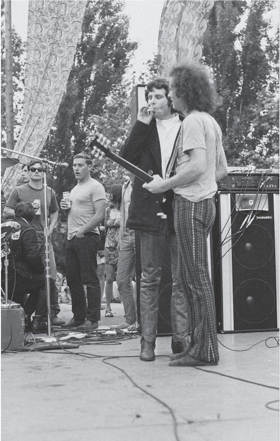
Jim ja Robby Krieger vetävät henkeä kesken keikan.