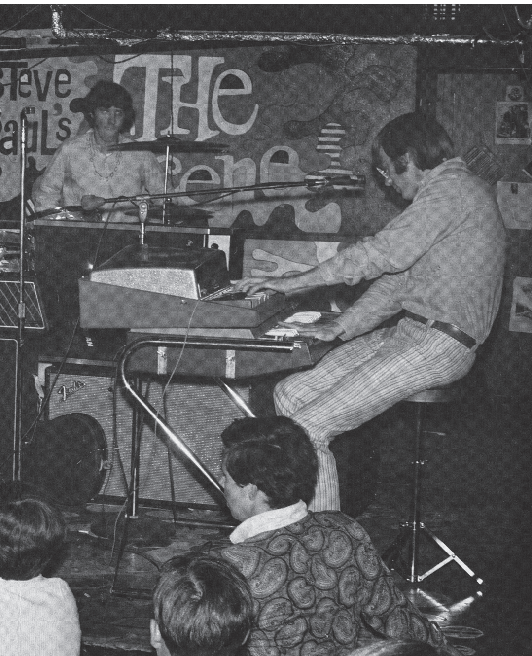
Doors esiintymässä pienellä bluesklubilla The Scene New Yorkissa.