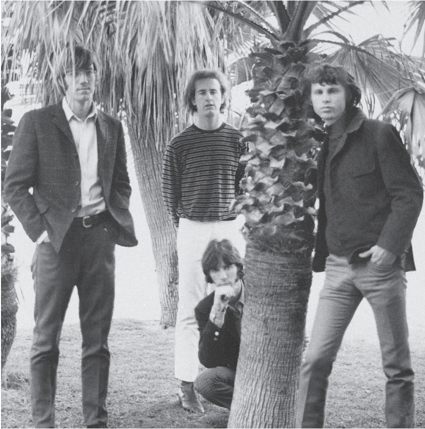
Doors Venicen rannalla vuonna 1966.

vajaa vuosi aiemmin. Tai ehkä hän vain joi liikaa alkoholia. Kaikki olivat yksimielisiä siitä, että kuolema ei voinut johtua heroiinista. Alkoholi oli Jimin päihde.