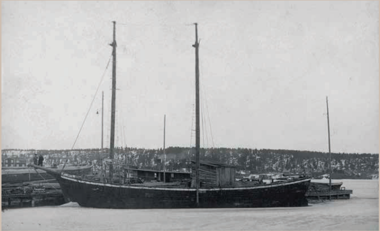
Galjotti Laatokalla. 1880–1909.