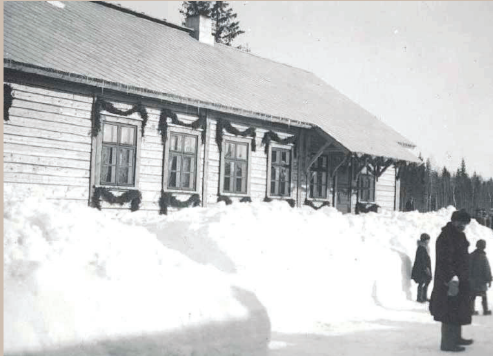
Koristeltu Uuksun rautatieasema. Kuvaaja Vilho M. Laiho, tuottaja Rautatiehallituksen mainostoimisto, 1930–1939. Suomen Rautatiemuseo, VR:n kuvakokoelma.

Kalastus oli Salmissa toiseksi tärkein elinkeino erityisesti niissä kylissä, jotka sijaitsivat Laatokan rantamalla. Näitä olivat esimerkiksi Lunkulansaari, Mantsinsaari ja Ala-Uukso. Kalastuskausi keskittyi syksyyn, jolloin pyydettiin verkoilla mm. muikkua ja siikaa. Muita tärkeitä elinkeinoja olivat metsästys, metsätalous, teollisuus ja kaupankäynti. 4