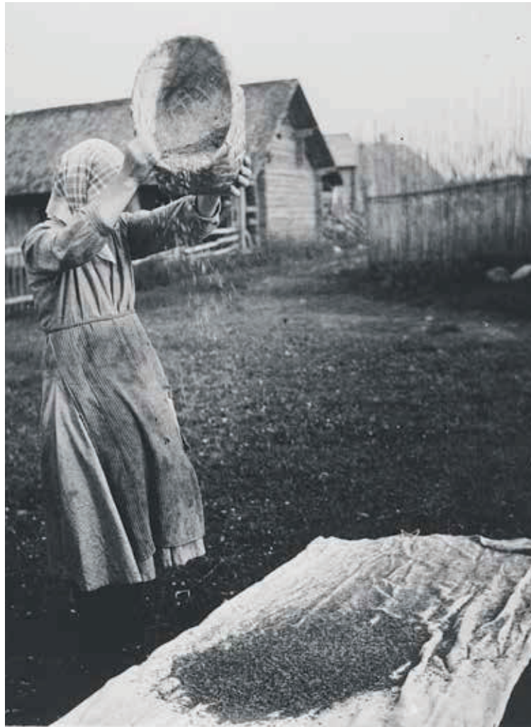
Viljan puhdistusta ”tuultamalla” Salmin Rajaselän kylässä. Kuvaaja M. E. Palomäki, 1930–1939. Museovirasto, Historian kuvakokoelma.

peitettyinä. Kokonaisen päivän ne saivat imeltyä ( imittyö ). Idy imeltyi paremmin, jos siihen ennen uuniin panoa sekoitettiin mallasjauhoja. Idyjauhokse (mallasjauhoiksi) aiotut maltaat saivat itää vähän enemmän kuin sinänsä syötäväiksi tarkoitettut. Ennen jauhamista ne kuivattiin uunin pohjalla. Vielä nyt muutamat emännät aina itse tekevät idyjauhot , joita joka talossa tarvitaan varsinkin vuasan (sahdin) valmistamiseen. Vanha tapa jauhaa maltaat käsikivillä on myös säilynyt. Nykyään kuitenkin monet ostavat mallasjauhoja. Näistä ostetuista jauhoista käytetään solodu- ja solodujauho- , välistä myös idyjauho- nimitystä.