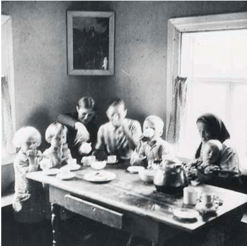
Perhe kahvipöydässä Salmissa. Kahvia juotaessa pöytäliinaa ei yleensä käytetty. Kuvaaja Eino Mäkinen, 1930–1939. Museovirasto, Historian kuvakokoelma.

oli valutettu pois. Mainittakoon myös eräs harvoin käytetty, mutta alkuperäinen tuoreen tatin kypsentämistapa. Saloniityn keittopaikalla, metsään tehdyllä nuotiolla tai välistä kotonakin lämpivän uunin eteen vedetyillä hiilillä paistettiin ( pastettih ) tikkuun pistetty tatti, jolle oli ripoteltu suolaa. Kuivatut tatit piti liottaa ( livottua ) ja kiehauttaa ( kiehaškoittua ) ennen käyttämistä. Niistä ja ohransuurimoista keitettiin vellin tapaista gri-bakuašua , ja toisinaan niitä paistettiin riehtiläl (riehtilällä eli paistinpannulla) ruokaöljyssä tai voissa joko yksistään tai sitten yhdessä suolattujen sienien kera. Lisätiinpä niihin joskus keitetyjä paloitetuja perunoitakin.