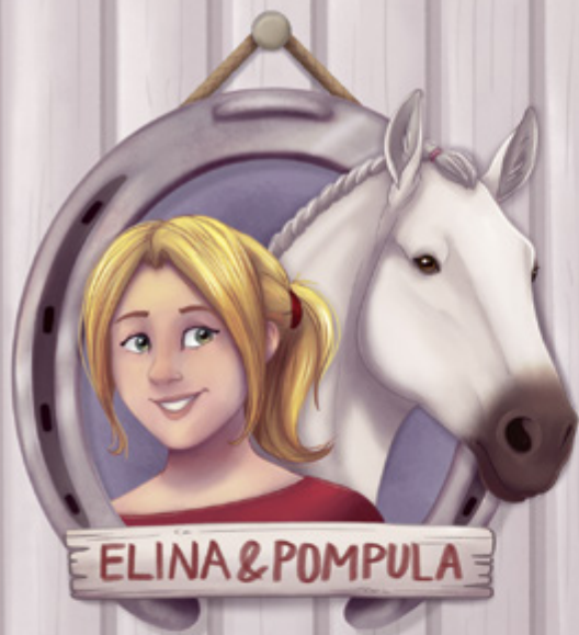
ELINA & POMPULA