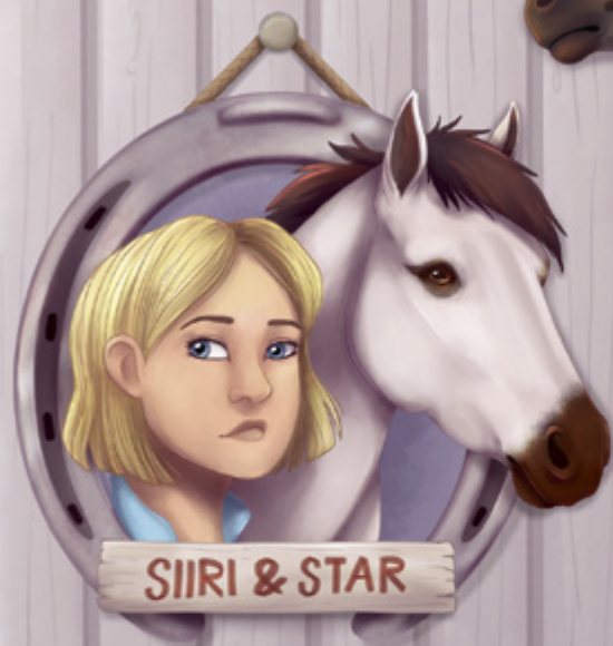
SIIRI & STAR